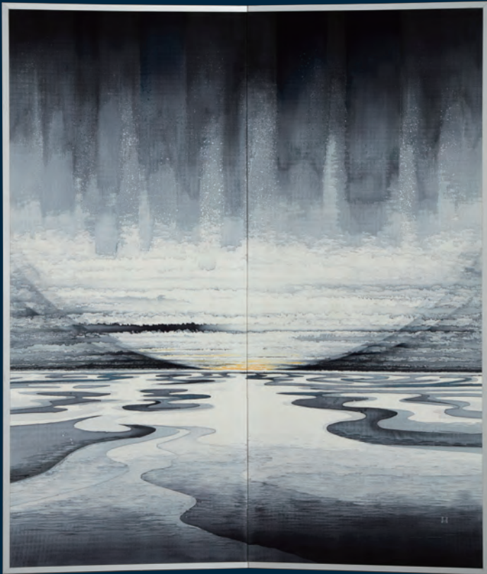
小川泰彦《不知火の有明》