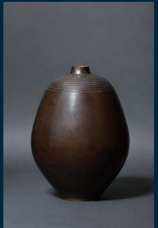
豊田勝秋《青銅花器》